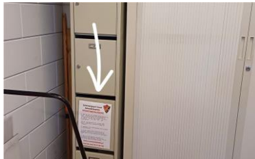
Inleverpunt in hal

LET OP: het betreft dus alleen SMHC wedstrijdshirts/-rokjes/-broeken en -sokken!